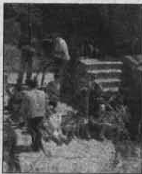
Il set del film girato a Tursi A PAGINA 17